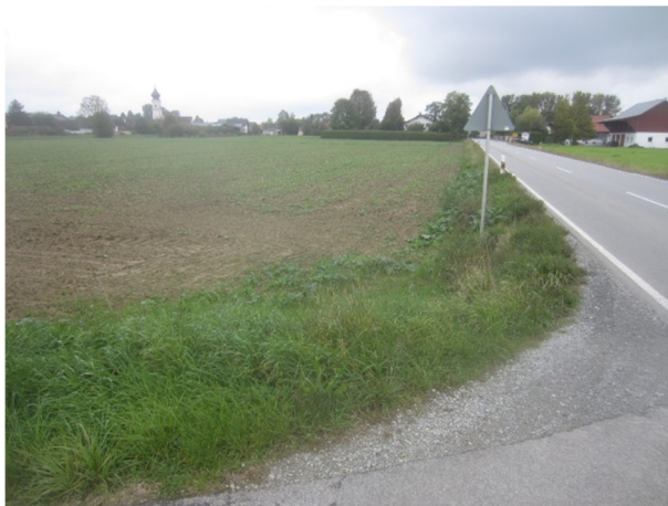
Abb. 4: Blick von Osten nach Westen auf Höhe der Feldzufahrt im Bereich der Münchsdorfer Straße

Das überplante Gebiet ist relativ eben. Es fällt von Süd (ca. 345,00 m. ü. NHN) nach Nord (ca. 344,00 m ü. NHN) leicht ab.