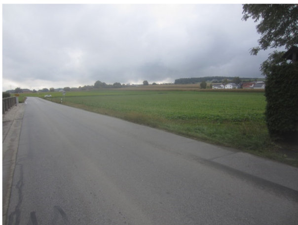
Abb. 6: Blick von Westen nach Osten auf Höhe der Wohnbebauung