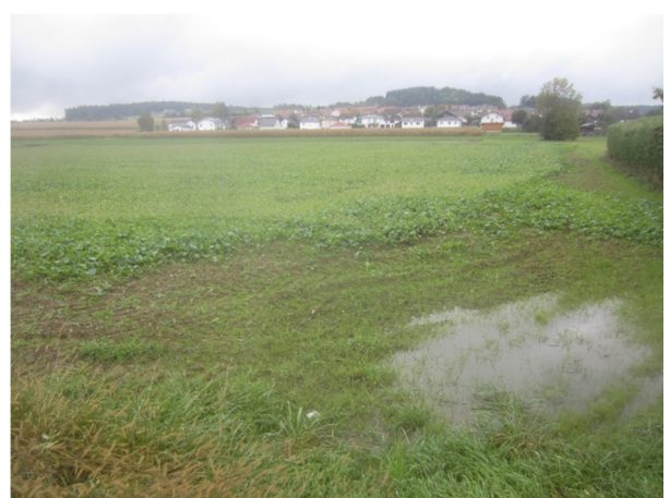
Abb. 7: Blick von der Münchsdorfer Straße nach Süden auf Höhe der westlichen Grundstücksgrenze

Innerhalb des Geltungsbereiches befinden sich keine ausgewiesenen Landschaftsschutzgebiete, Natura-2000-Gebiete, Naturschutzgebiete, geschützte Landschaftsteile bzw. geschützte Naturdenkmale. Ebenso sind im Geltungsbereich keine amt-