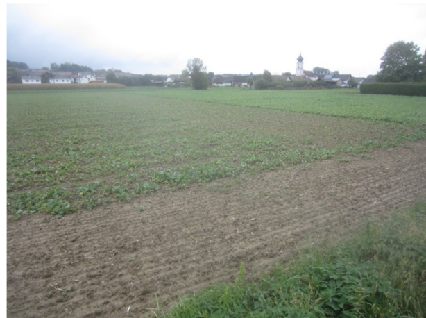
Abb. 5: Blick von der Münchsdorfer Straße nach Süden im Bereich der geplanten Einfahrt