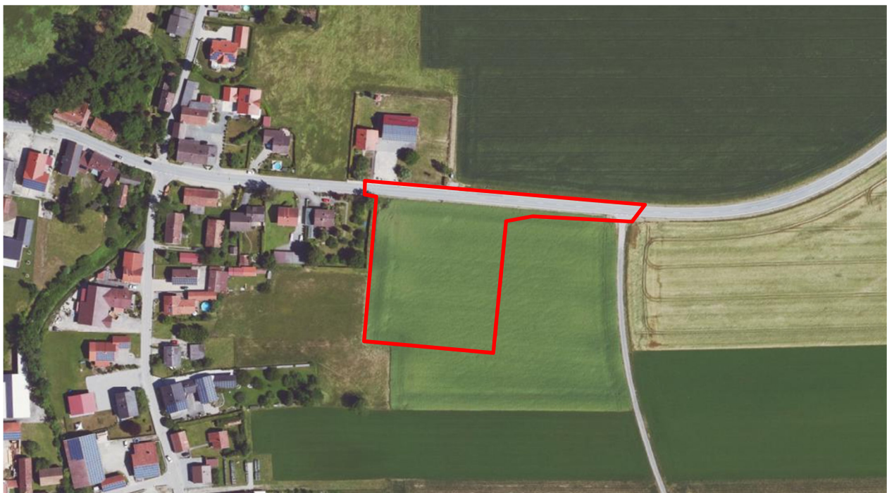
Abbildung 2: Luftbildausschnitt aus dem BayernAtlas vom 08.03.2023 - ohne Maßstab