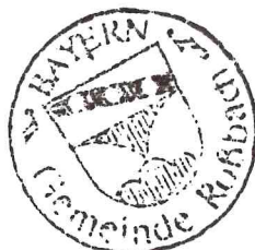
Ludwig Eder Erster Bürgermeister