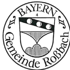
Ludwig Eder | Erster Bürgermeister Gemeinde Roßbach