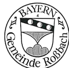
Ludwig Eder | Erster Bürgermeister