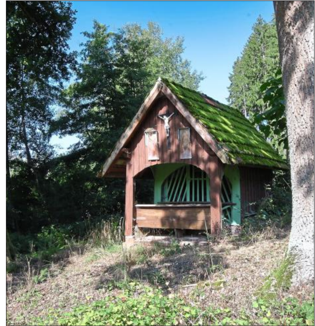
Auf den Wanderrouten und bei den geführten Themenwanderungen gibt es teils unbekannte Natur- und Kulturschätze zu entdecken.