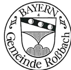
Ludwig Eder | Erster Bürgermeister